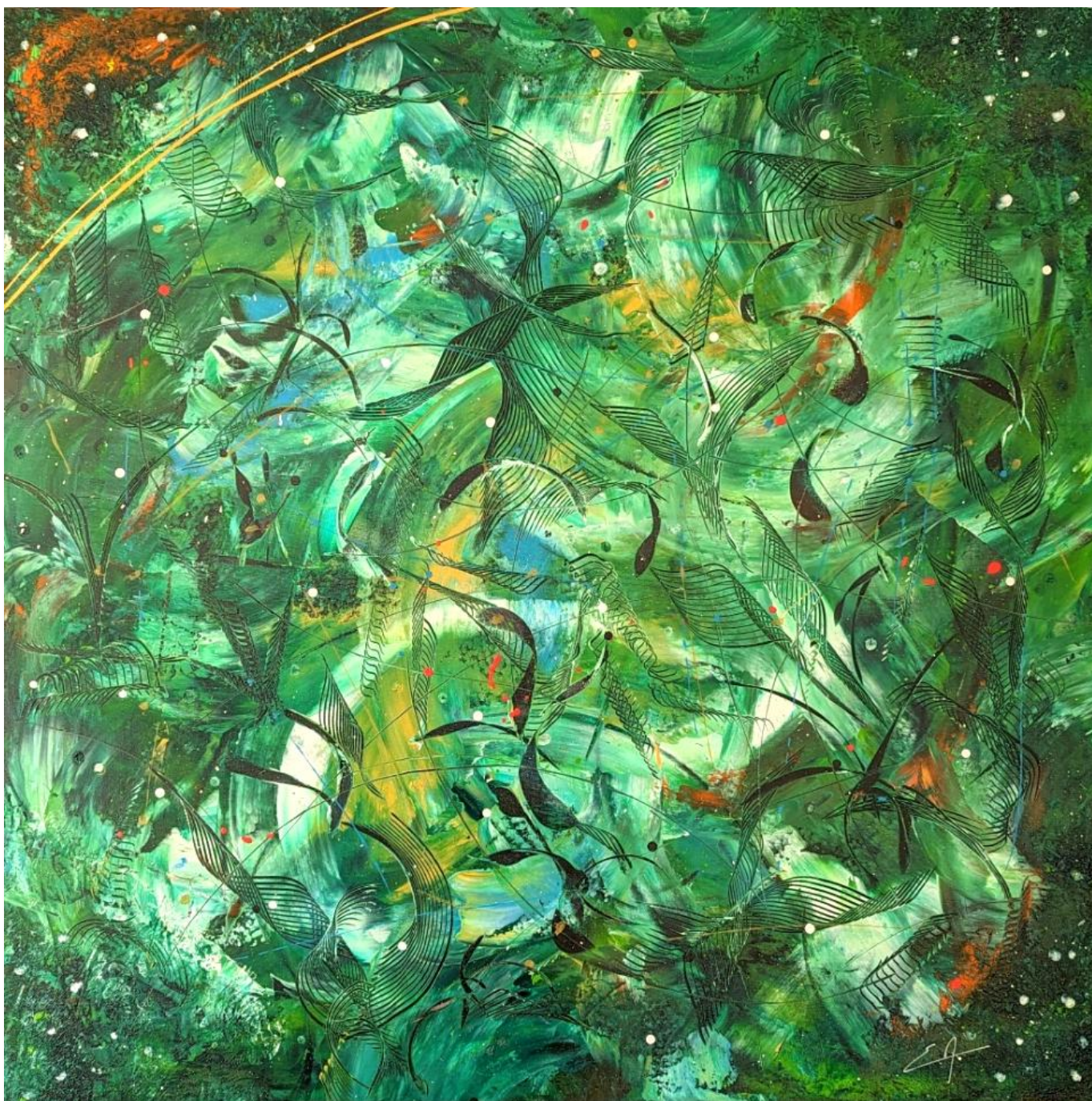
Et au Milieu Coule une Rivière - Acrylique 100 x 100 cm - Collection Green – 2023