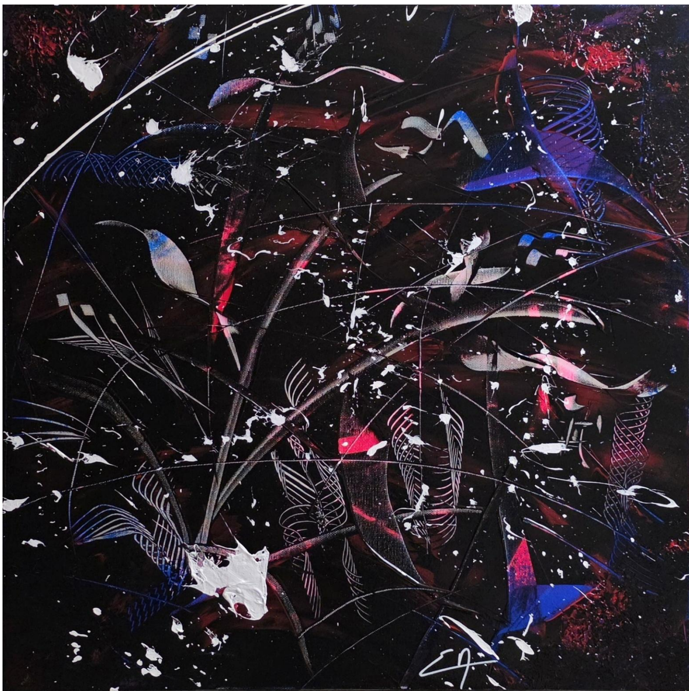
Fracture - Acrylique 60 x 60 cm - Collection Black – 2026