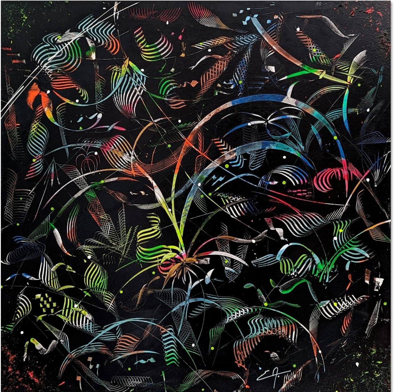
Symphonie Nocturne - Acrylique 100 x 100 cm – Collection Black – 2024