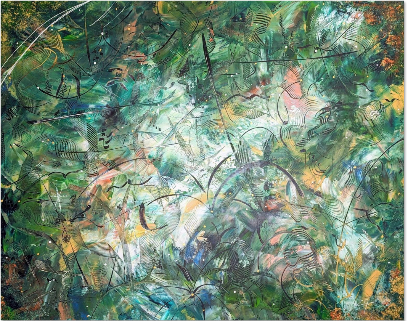
Bornéo - Acrylique 130 x 162 cm – Collection Green – 2023