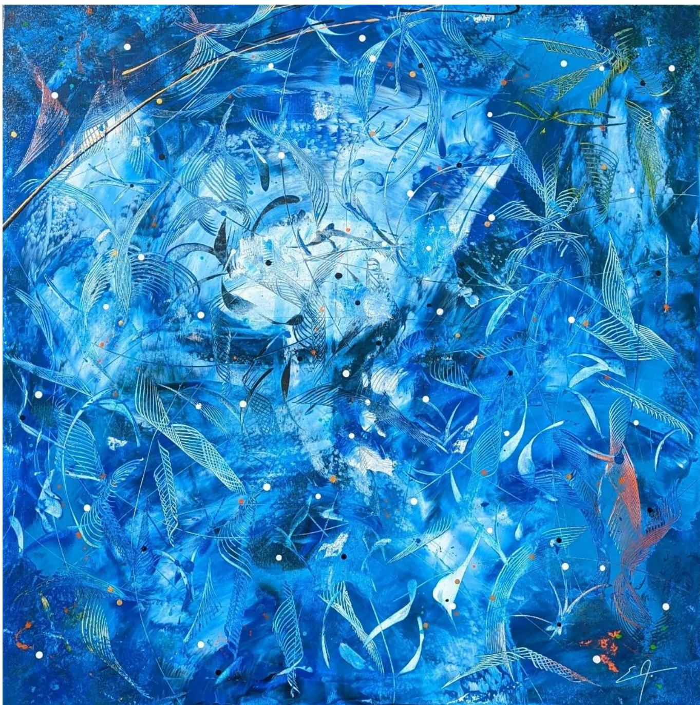
Pélagos - Acrylique 100 x 100 cm - Collection Océanique – 2023