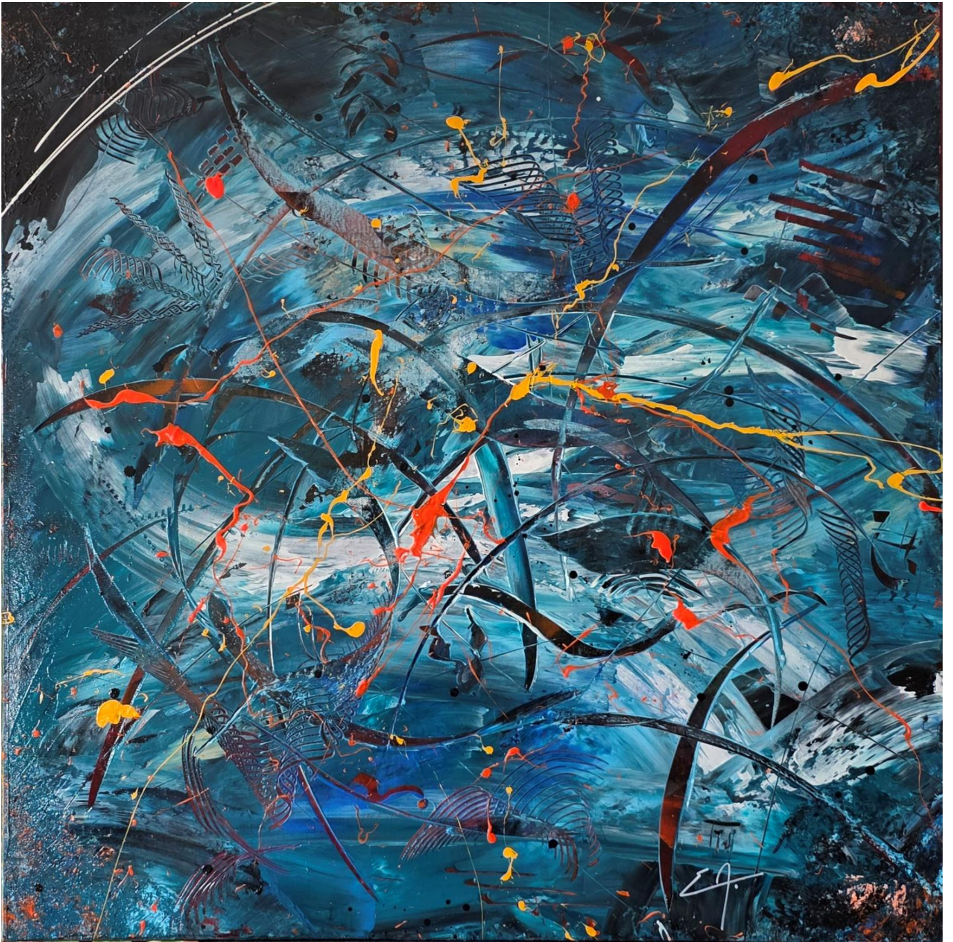
Le Courroux - Acrylique 70 x 70 cm – Collection Océanique – 2026