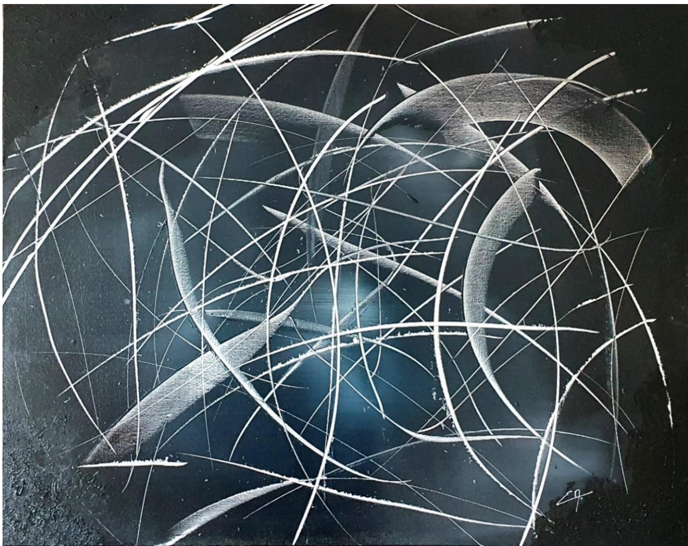
Déchire la Nuit – Acrylique 73 x 92 cm – Collection Black – 2022