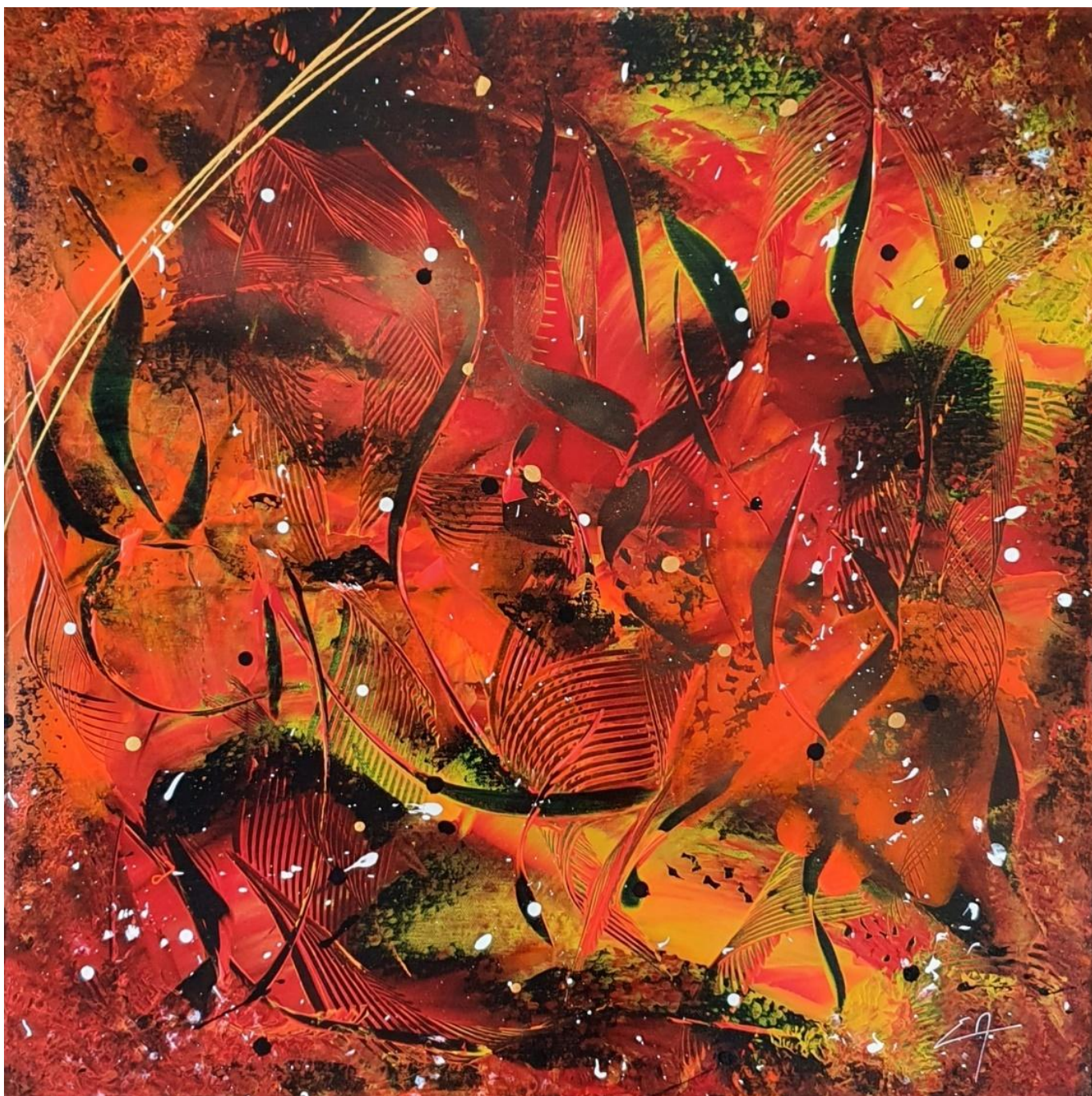
Fire - Acrylique 60 x 60 cm – Collection Colors – 2022